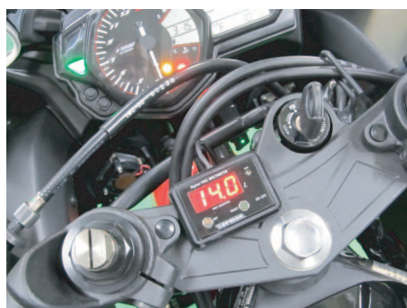
メーターはトップブリッジに貼り付け。