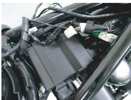
配線の接続先は、シート下のECUカプラーおよび白4Pカプラーの配線。