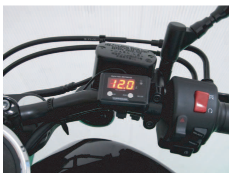
ハンドルバーに付属のステーを使って装着。