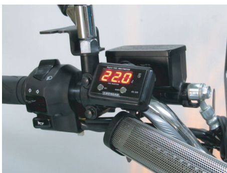
ハンドルバーに付属のステーを使って装着。