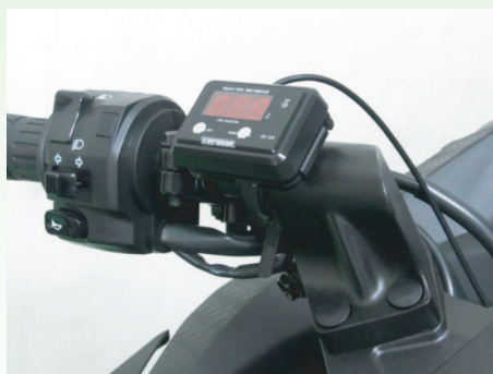
ハンドルバーに付属のステーを使って装着。