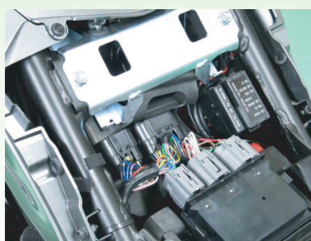
配線の接続先は、シート下のECUカプラーおよびバッテリーマイナスへ