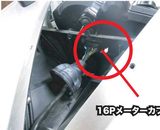
16Pメーターカプラー