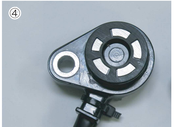
④5か所の接点をパーツクリーナー で洗浄します。