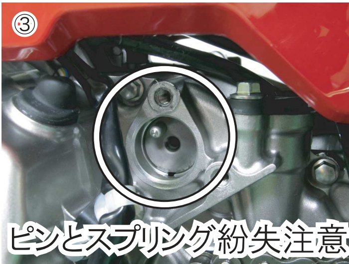
③ギヤポジションセンサーを 取り外します。