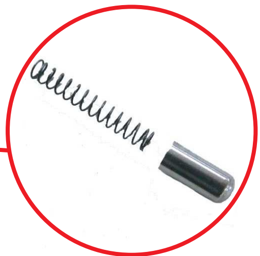
⑤赤丸で囲った部分のピンとスプリングを取り外し、スプリングを数ミリ 伸ばしテンションを強くする事で接触が良くなり表示不良の改善になります。